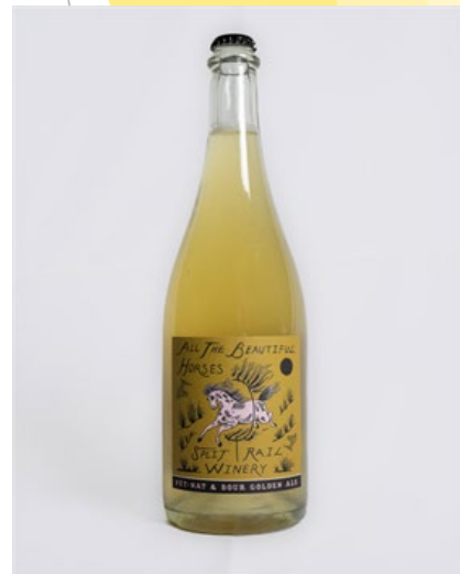
Split Rail Winery