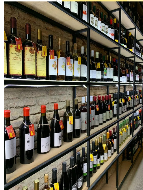
Nino Meris wine shop in Tbilisi, Georgia.